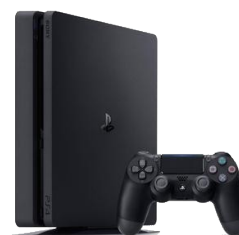
Console de jeux