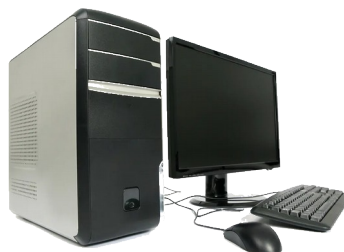
Ordinateur de bureau